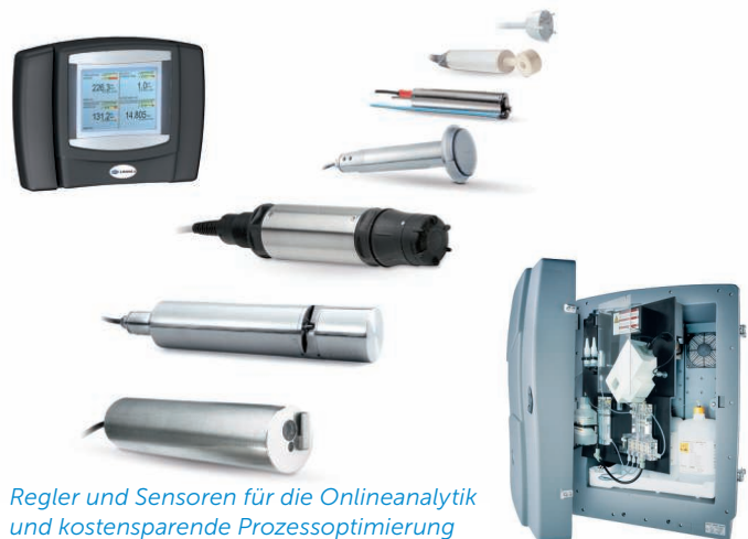
Regler und Sensoren für die Onlineanalytik und kostensparende Prozessoptimierung