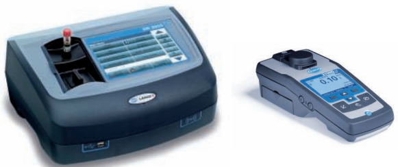
Benchtop- und tragbare Geräte für Laboranalyse, Instandhaltung und Gerätequalifizierungsdienste verfügbar

* Für weitere Parameter und Lösungen kontaktieren Sie bitte Ihren HACH LANGE Vertreter vor Ort, oder besuchen unsere Website.